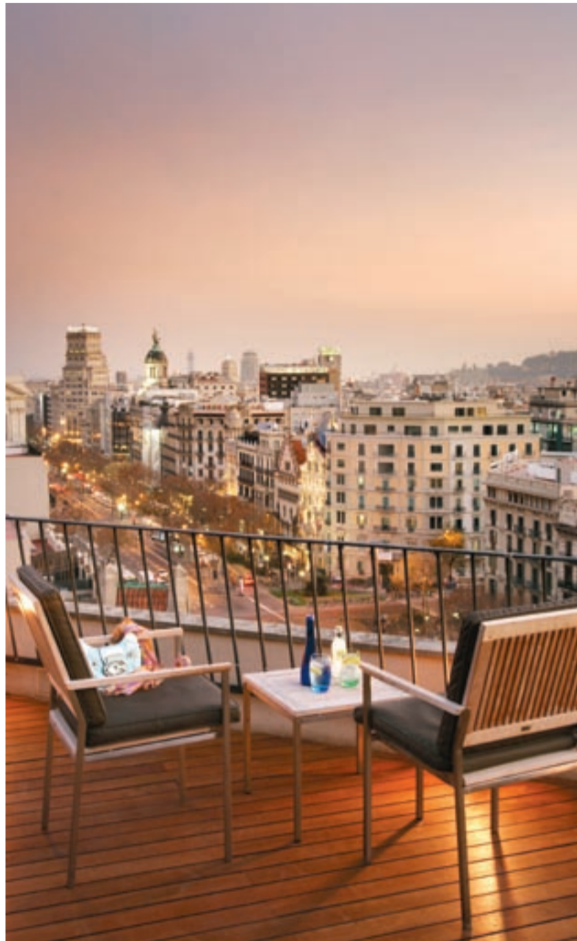
Le toit de l'hôtel 5* Majestic à Barcelone