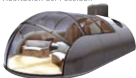
Habitación del Poseidon

de la NASA, pudiendo descender con total seguridad hasta 610 metros por debajo del nivel del mar y permaneciendo hasta 19 días sumergido.