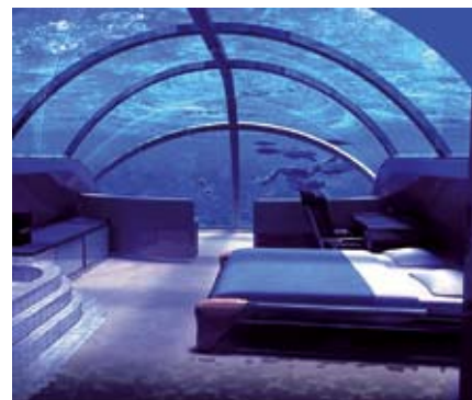
Interior del Poseidon

Para saber más: 951 31 95 45 ó info@theresabernabe.com