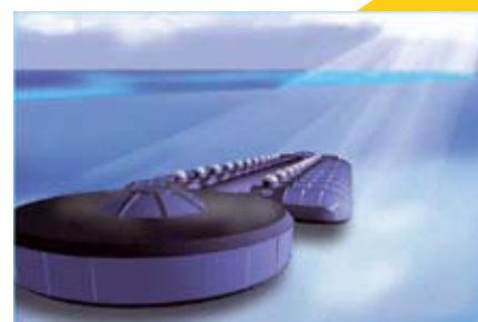
Punto de acceso al Poseidon