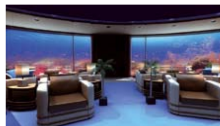
Interior del Poseidon