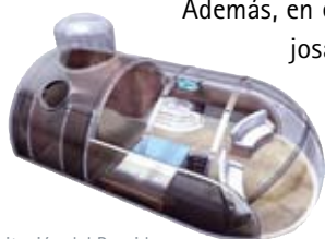
Habitación del Poseidon

El afortunado "capitán" de este exclusivo y lujosísimo medio de transporte puede optar entre pilotarlo desde un puente de mando con joystick digital o dirigirlo con auténtica precisión suiza desde una posición externa con control remoto. Debajo del puente de mando se encuentra un espacioso salón principal con bar al que se accede por escalera o ascensor y desde el que se pueden disfrutar de unas vistas realmente espectaculares bajo el agua. En la misma planta se encuentran seis camarotes decorados en distintos estilos con aseo propio y ventanas de 1,50 m de diámetro en forma de lente. Bajando al piso inferior nos encontramos con el comedor, una gran sala equipada con una pantalla con sistema de sonido Dolby Digital digna de una sala de cine privada.