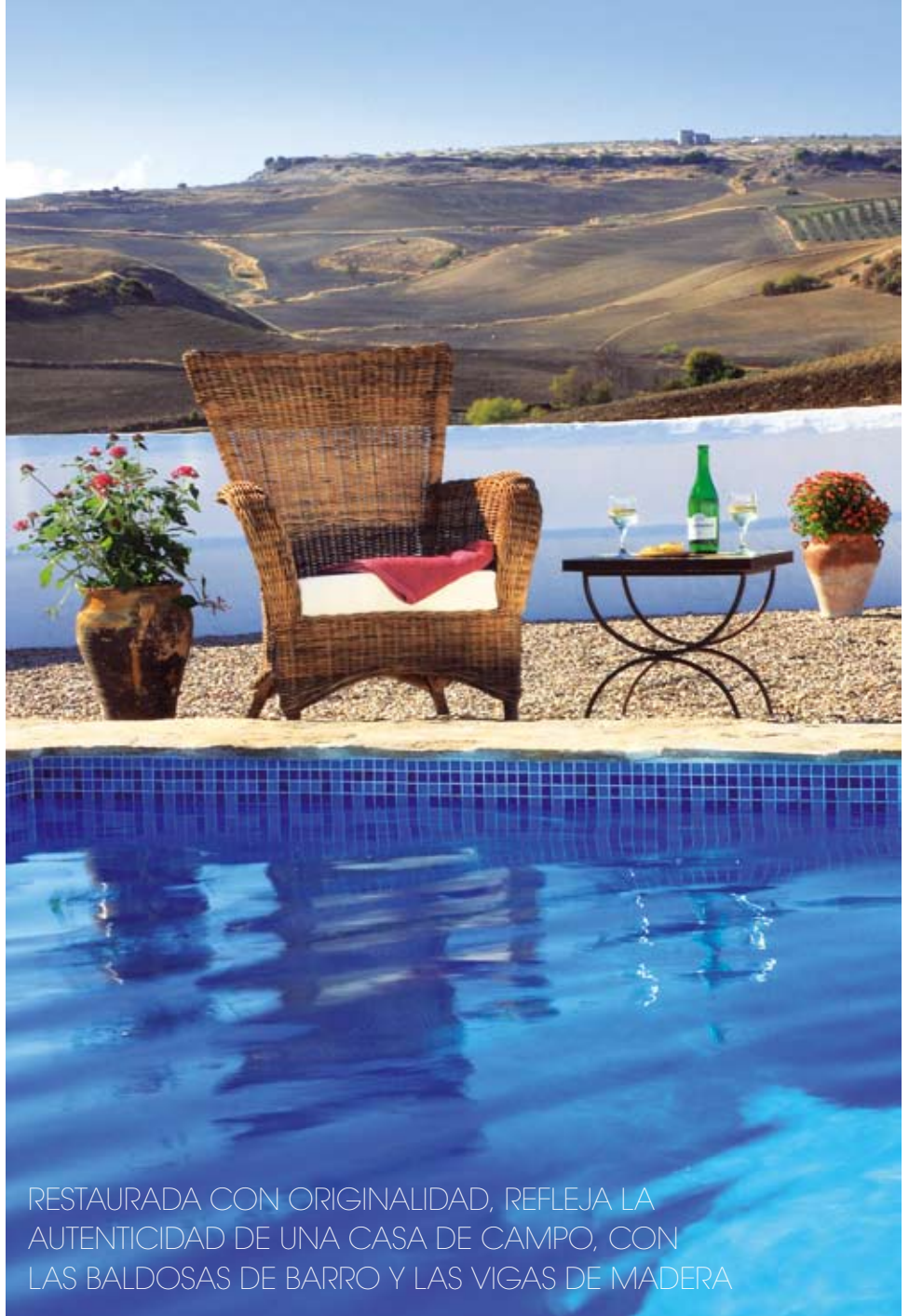
RESTAURADA CON ORIGINALIDAD, REFLEJA LA AUTENTICIDAD DE UNA CASA DE CAMPO, CON LAS BALDOSAS DE BARRO Y LAS VIGAS DE MADERA

Imponente, este cortijo ubicado en Ronda, se encuentra dentro de un paraje extraordinario de 40.000 metros cuadrados de terreno llano. Toda la decoración está cuidada al detalle y combina su toque tradicional con el confort, dando como resultado una casa sumamente acogedora. Restaurada con originalidad y encanto, refleja la autenticidad de la casa de campo andaluza, con las baldosas de barro, vigas de madera y las paredes suavemente terminadas. La propiedad incluye una acomodación generosamente dispuesta con un amplio salón, una sala de estar con chimenea y estudio adyacente, salón comedor, cocina de campo, baño completo, suite principal con dormitorio y baño con ducha y tres dormitorios dobles. También cuenta con un chalet para los invitados que ofrece un recibidor, un amplio salón con comedor y un confortable dormitorio doble. En la parte externa se encuentra la piscina decorada con finos azulejos, terrazas de grava y decoraciones en piedra, ofreciendo unas magnificas vistas al campo y la Serranía. Un lugar perfecto para disfrutar de la naturaleza y la tranquilidad.