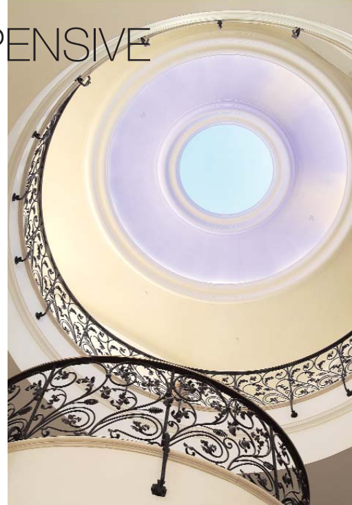
Todas las imágenes pertenecen a la mansión Updown Court y han sido cedidas por Theresa Bernabé. More information: www.theresabernabe.tv

Las tres propiedades inmobiliarias más caras del mundo sobrepasan ya la barrera de los cien millones de euros. Con 4.400 m 2 divididos en 4 plantas, la mansión inglesa Updown Court de estilo georgiano, encabeza actualmente este ranking. A la venta por 115 millones (en España, posee la exclusiva la inmobiliaria Theresa Bernabé), dispone de helipuerto, 6 piscinas climatizadas, pistas de tenis, bolos y squash, establos, habitación del pánico, casa de invitados de 800m 2 , 58.000m 2 de jardines (superficie mayor que Buckingham Palace), etc.