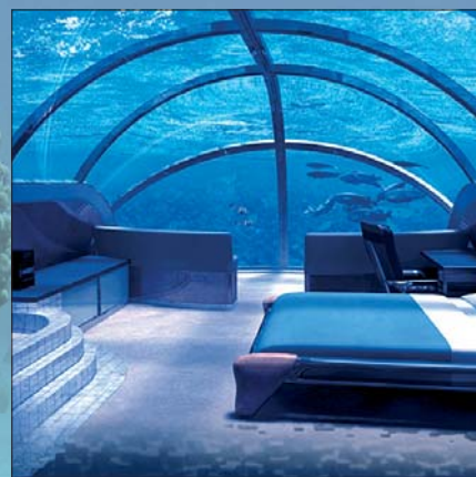
Vista de una de las habitaciones de 'Poseidon'.