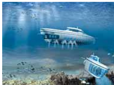
CANAL THERESA BERNABÉ