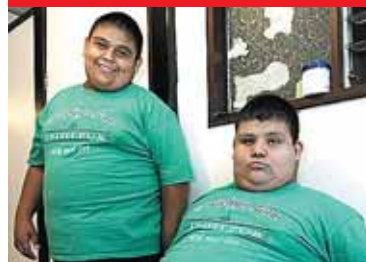
El médico les recomienda hacer deporte.